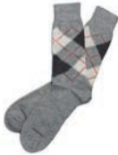
Gewone sokken: 0,02 clo