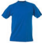
T-shirt met korte mouwen: 0,10 clo