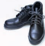
Schoenen: 0,02 - 0,04 clo