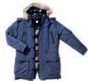
Parka: 0,70 clo