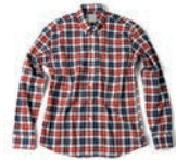
Hemd met lange mouwen: 0,20 - 0,30 clo