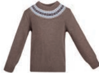
Dikke trui: 0,20 - 0,40 clo